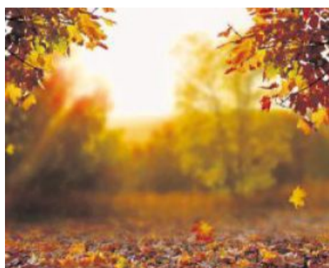
Bald ist es soweit: Die Natur im Farbenrausch...

B ald merkt man es auch im Garten: Wenn sich die Blätter verfärben, beginnt der Herbst. Es ist kälter geworden, die Nächte sind länger – ein Reiz, der die Bäume dazu veranlasst, ihre Farbe zu verändern. Genauer gesagt, die Veränderung hängt mit der Verarbeitung des Sonnenlichts in den Blättern zusammen. Also mit dem Prozess der Photosynthese durch den die Pflanzen Stärke und damit Energie zum Leben gewinnen.